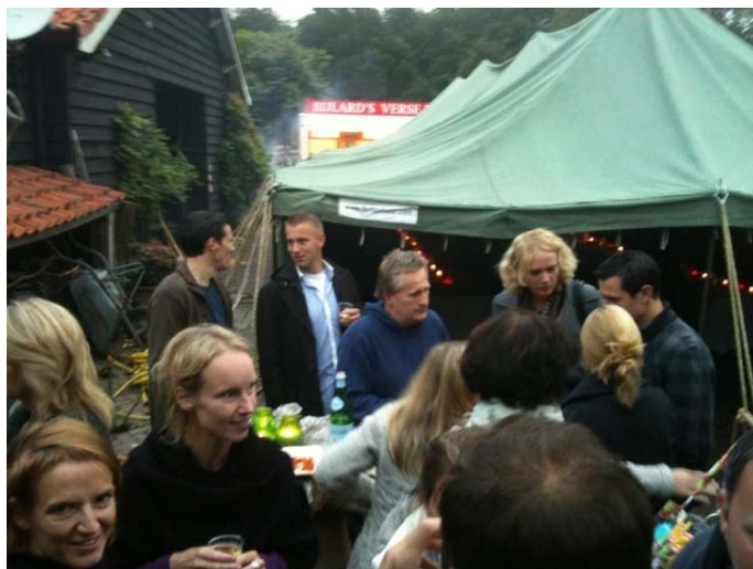
Foto: het door de Stichting Vrienden van de LMS georganiseerde lerarendiner (september 2010)

De Stichting Vrienden LMS is te bereiken via: vriendenlms@gmail.com . Meer informatie op de website www.vriendenlms.nl . Bankrekeningnummer 33.49.52.859 t.n.v. Stichting VLMS