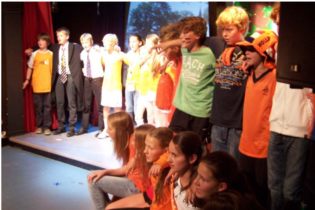
Afscheidsmusical groep 8 (juli 2011)

Gedurende de laatste periode van het jaar richt Koos zich sterk op de afscheidsmusical van groep 8, die door de kinderen, Koos en leerkrachten samen wordt bedacht en uitgevoerd..