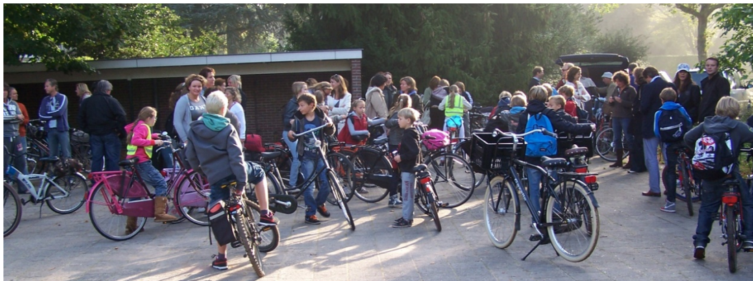
Groep 7-8 gaat op schoolkamp (september 2010)

Voor de goede orde wordt erop gewezen dat er naast of in plaats van een vrijwillige ouderbijdrage ook een (fiscaal aftrekbare) schenking kan worden gedaan aan de Stichting Vrienden van de LMS. Meer informatie over de Stichting Vrienden van de LMS staat in het volgende hoofdstuk.