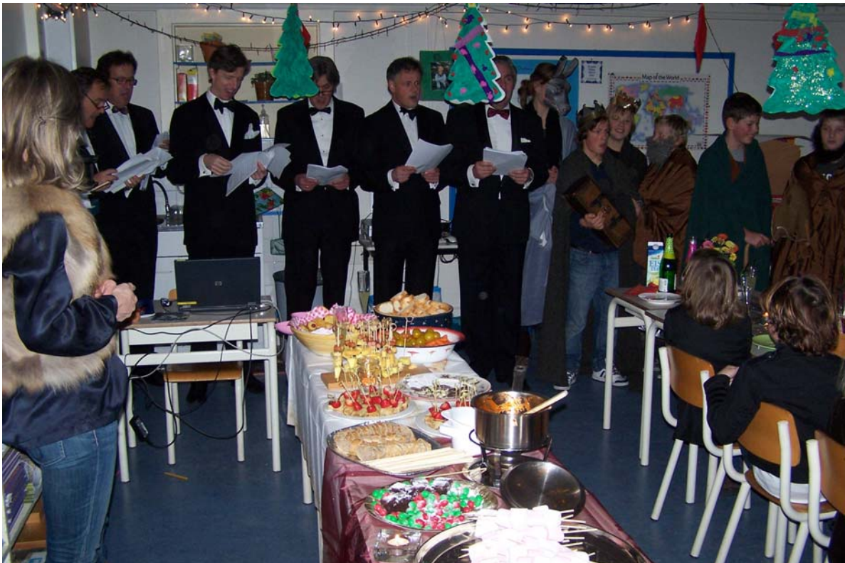
Kerstviering met het 'Mannenkoor van de LMS'

Groep acht zet in het laatste jaar de puntjes op de i. In februari doen we mee aan de CITO-eindtoets. Met het advies van de leerkracht resulteert de uitslag in een definitief advies voor het voortgezet onderwijs.