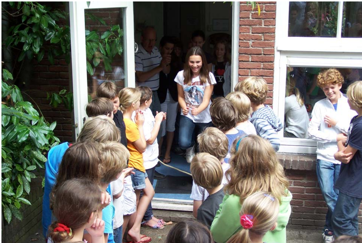
Het 'uitspringen' van groep 8 in juli 2011

Voor specifieke informatie kunt u zich wenden tot de afdeling plaatsing en planning van het regiokantoor: Kinderopvang Humanitas Flevostraat 10 1315 CC Almere tel. 036-5298930, bereikbaar maandag t/m vrijdag van 8.15 uur-17.15 uur.